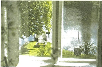
Kaffestugan är stängd för tillfället, men annars är utsikten mot Raslången och Ronnebyån bedårande från Karlsnäsårdens huvudbyggnad.