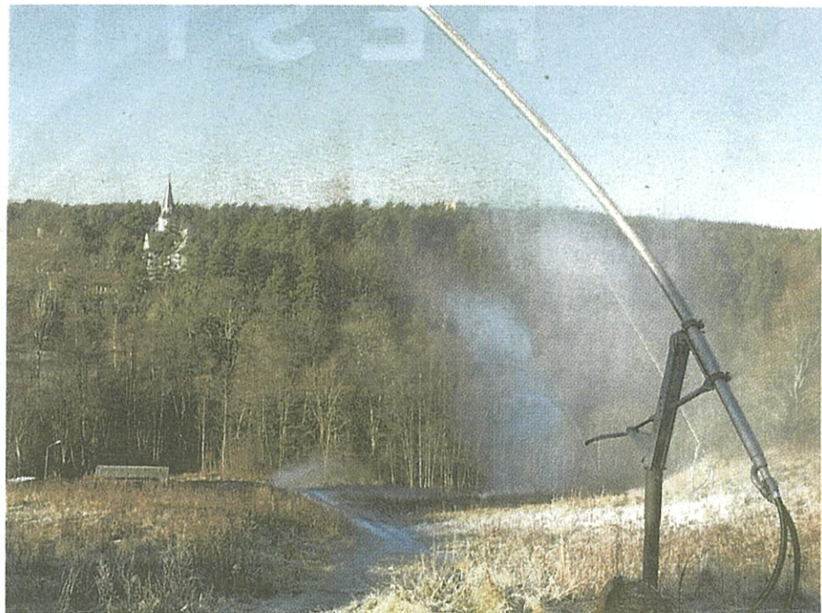
Efter rekordåret 2018 storsatsade Rödebybacken på snökanoner. Den här säsongen har de inte använts en enda gång.

I mitten av januari hölls en volontärbildning för intresserade. Förutom några äldre volontärer dök tre nya personer upp. Alla tre med sikte på snökanonerna. Föreningen köpte ny utrustning förra året