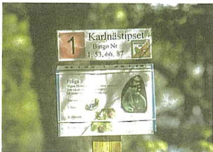
Tipspromenaderna hade sin storhetstid på 1990-talet. Rekordet är 499 personer på en och samma söndag. I dag lockar promenader mellan 150 och 200 motionärer varje vecka.

”Vi känner verkligen att det finns stora möjligheter att utveckla verksamheten här uppe i Karlsnäs. Nu har vi äntligen fått en långsiktighet som vi önskat i så många år.”