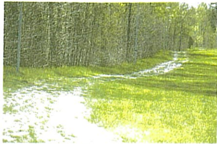
Här kan det bli en rullskidsbana inom en snar framtid.